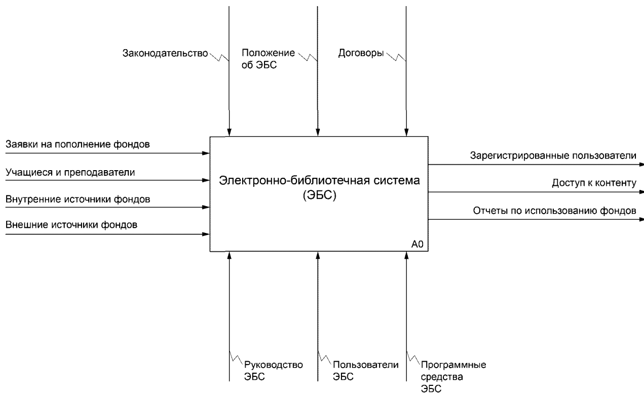
Рисунок А.1 - Контекстная диаграмма